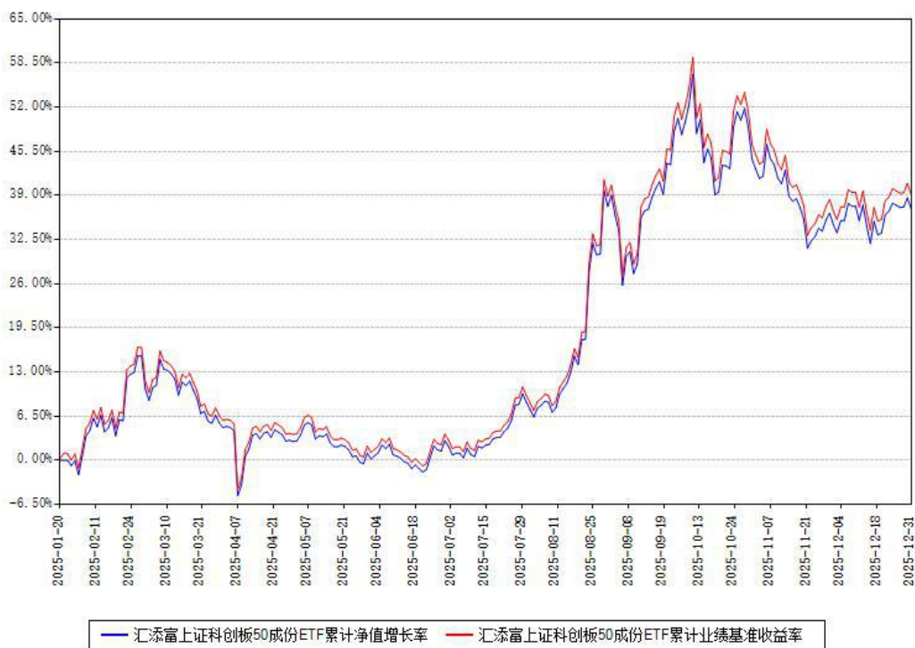
汇添富上证科创板50成份ETF累计净值增长率与同期业绩基准收益率对比图

注：本《基金合同》生效之日为 2025 年 01 月 20 日，截至本报告期末，基金成立未满一年。本基金建仓期为本《基金合同》生效之日起 6 个月，截至本报告期末，本基金已完成建仓，建仓期结束时各项资产配置比例符合合同约定。