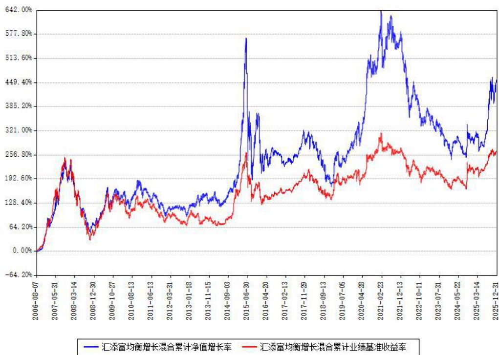
汇添富均衡增长混合累计净值增长率与同期业绩基准收益率对比图

注：本基金建仓期为本《基金合同》生效之日（2006年08月07日）起6个月，建仓期结束时各项资产配置比例符合合同约定。