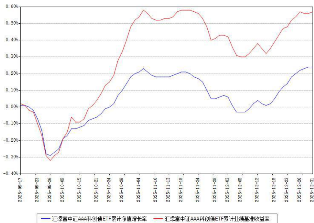
汇添富中证AAA科创债ETF累计净值增长率与同期业绩基准收益率对比图

注：本《基金合同》生效之日为 2025 年 09 月 17 日，截至本报告期末，基金成立未满一年。本基金建仓期为本《基金合同》生效之日起 6 个月，截至本报告期末，本基金尚处于建仓期中。