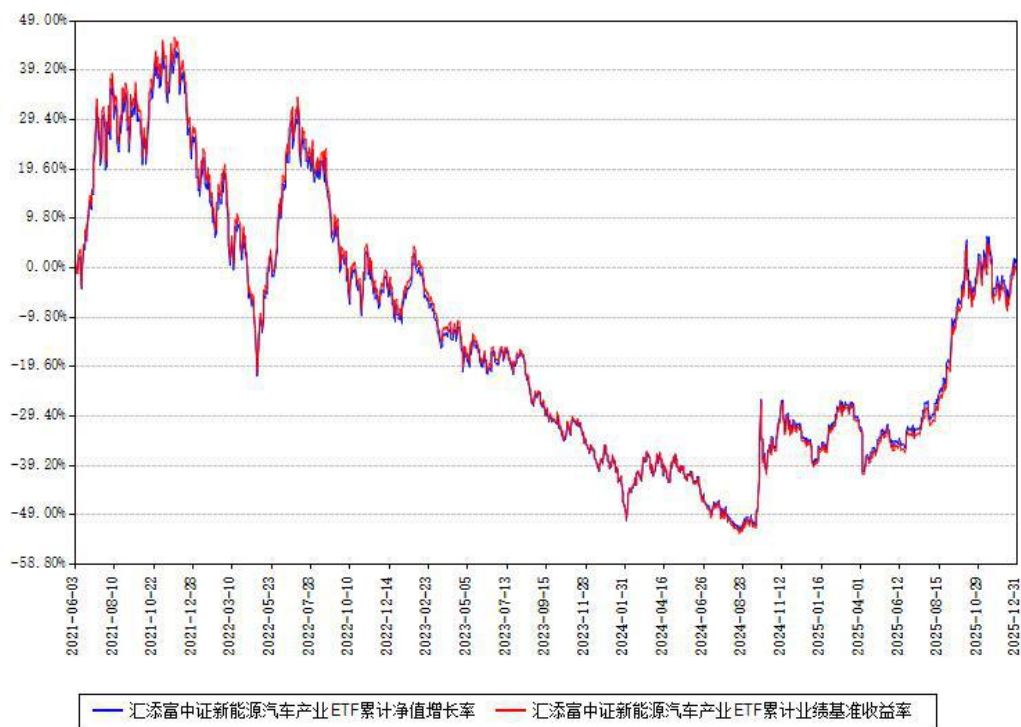
汇添富中证新能源汽车产业ETF累计净值增长率与同期业绩基准收益率对比图

注：本基金建仓期为本《基金合同》生效之日（2021年06月03日）起6个月，建仓期结束时各项资产配置比例符合合同约定。