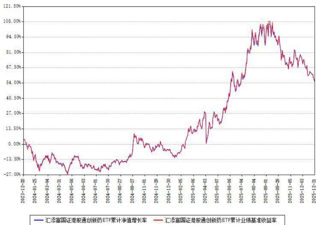
汇添富国证港股通创新药ETF累计净值增长率与同期业绩基准收益率对比图

注：本基金建仓期为本《基金合同》生效之日（2023年12月28日）起6个月，建仓期结