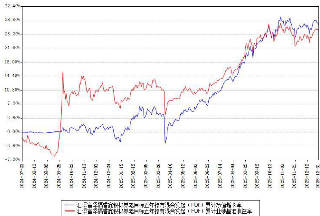
汇添富添福睿鑫积极养老目标五年持有混合发起（FOF）累计净值增长率与同期业绩基准收益率对比图

注：本基金建仓期为本《基金合同》生效之日（2024年07月23日）起6个月，建仓期结束时各项资产配置比例符合合同约定。