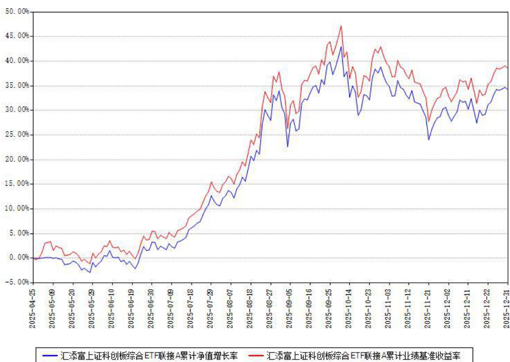
汇添富上证科创板综合ETF联接A累计净值增长率与同期业绩基准收益率对比图