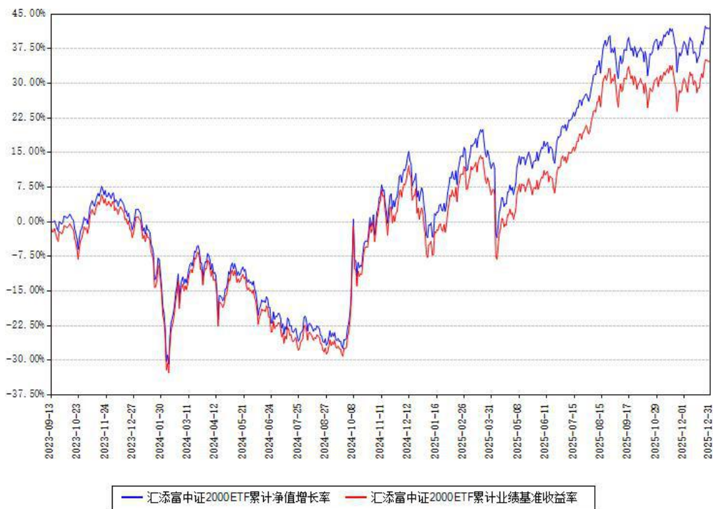
汇添富中证2000ETF累计净值增长率与同期业绩基准收益率对比图

注：本基金建仓期为本《基金合同》生效之日（2023年09月13日）起6个月，建仓期结束时各项资产配置比例符合合同约定。