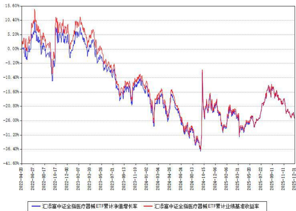
汇添富中证全指医疗器械ETF累计净值增长率与同期业绩基准收益率对比图

注：本基金建仓期为本《基金合同》生效之日（2022年04月28日）起6个月，建仓期结束时各项资产配置比例符合合同约定。