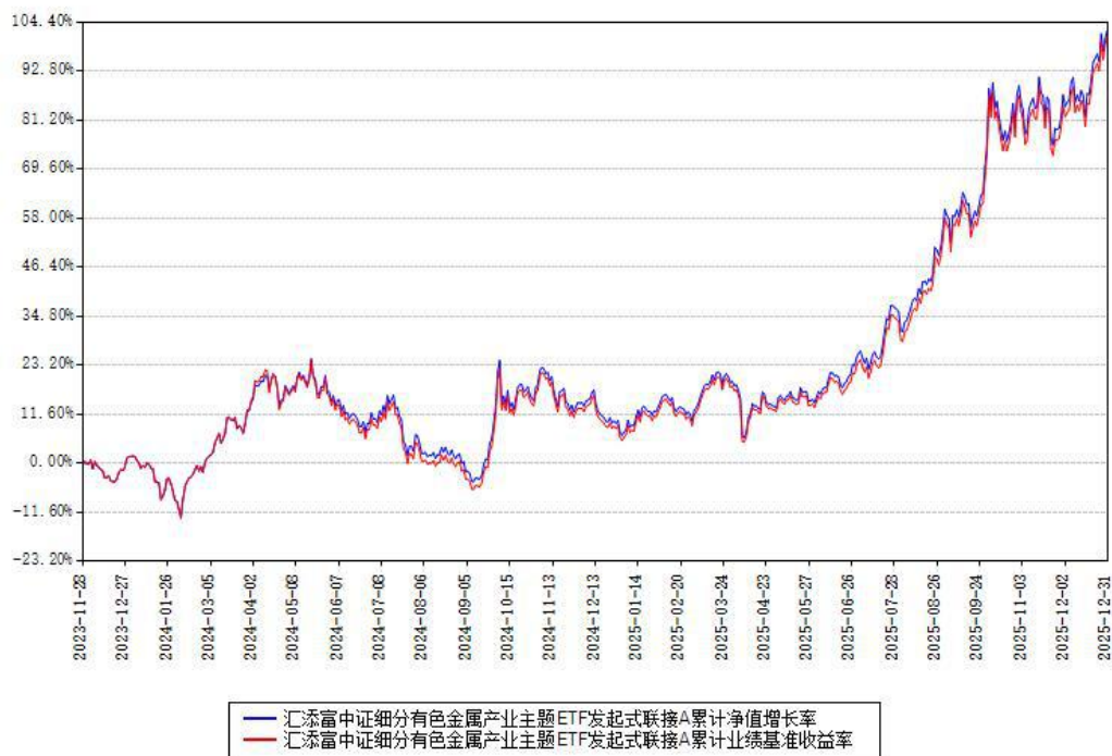
汇添富中证细分有色金属产业主题ETF发起式联接A累计净值增长率与同期业绩基准收益率对比图