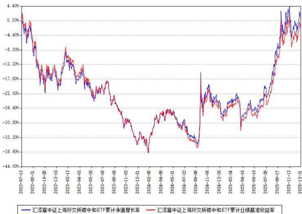
汇添富中证上海环交所碳中和ETF累计净值增长率与同期业绩比较基准收益率对比图

注：本基金建仓期为本《基金合同》生效之日（2022年07月13日）起6个月，建仓期结束时各项资产配置比例符合合同约定。