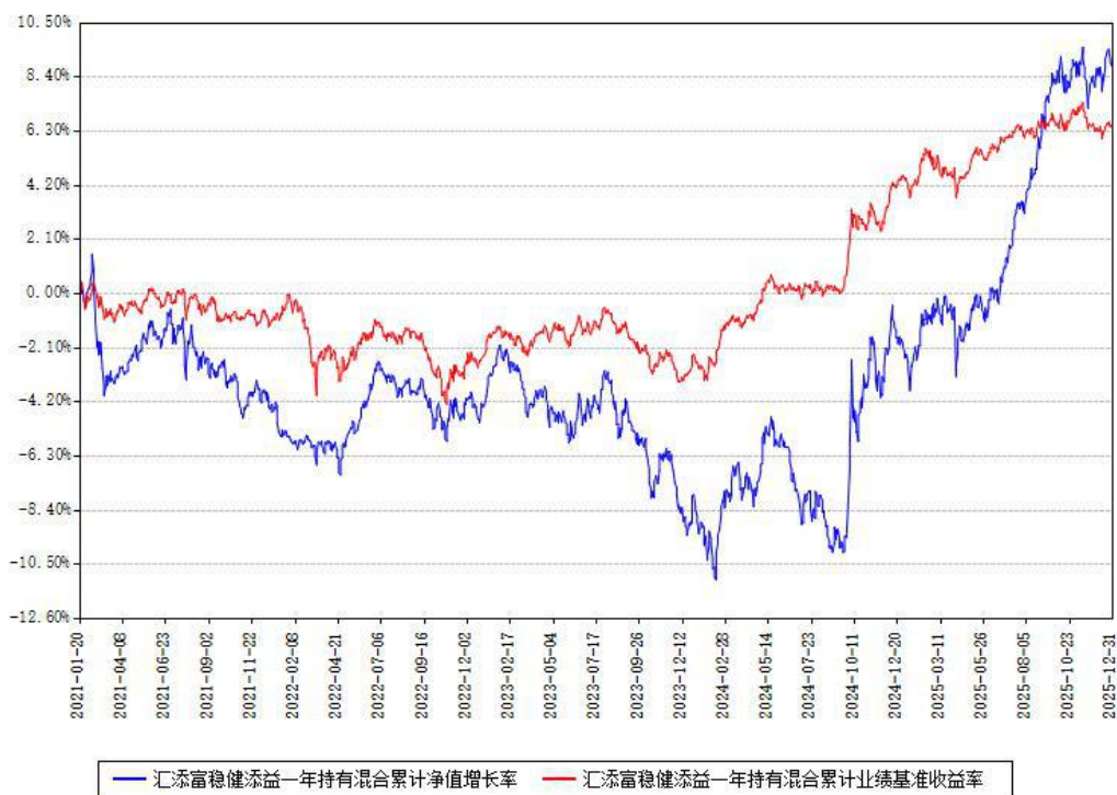
汇添富稳健添益一年持有混合累计净值增长率与同期业绩基准收益率对比图

注：本基金建仓期为本《基金合同》生效之日（2021年01月20日）起6个月，建仓期结束时各项资产配置比例符合合同约定。