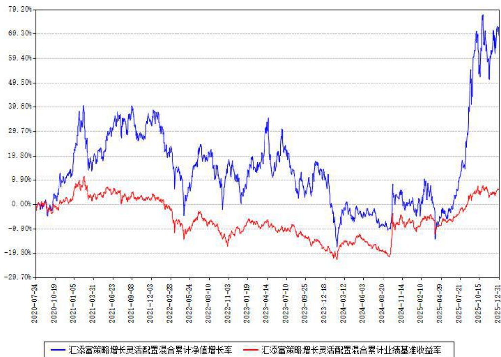
汇添富策略增长灵活配置混合累计净值增长率与同期业绩基准收益率对比图

注：本基金建仓期为本《基金合同》生效之日（2020年07月24日）起6个月，建仓期结束时各项资产配置比例符合合同约定。