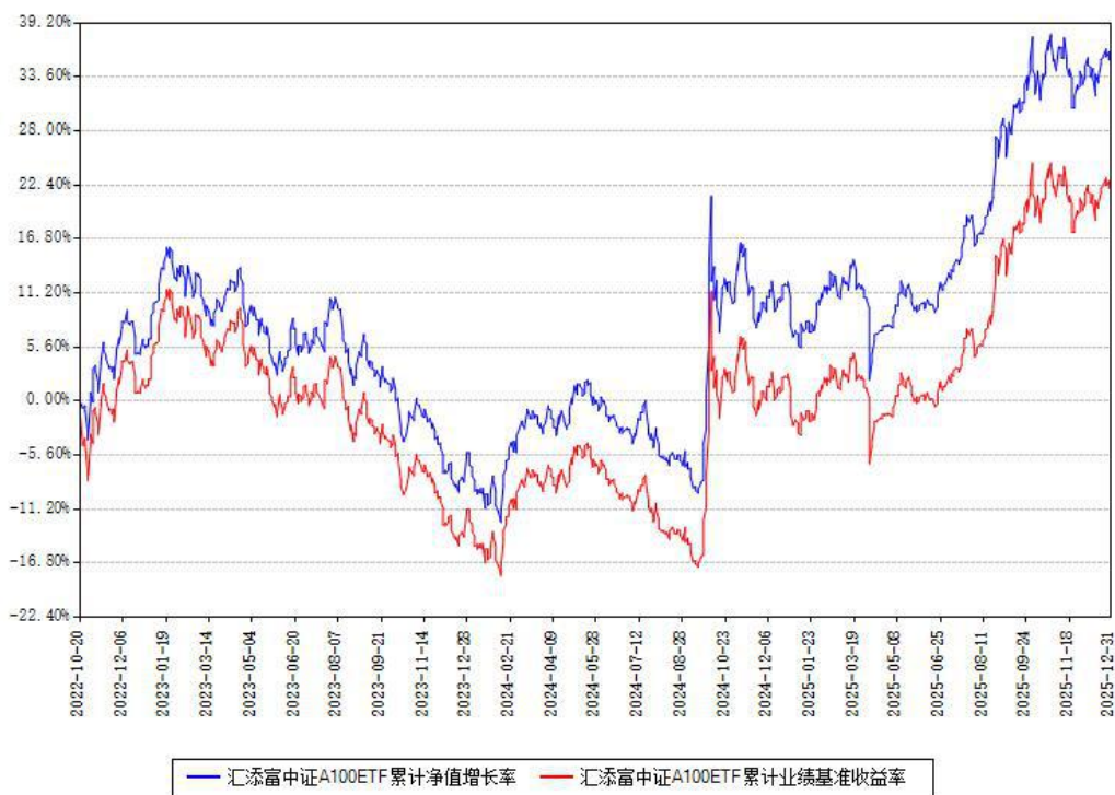
汇添富中证A100ETF累计净值增长率与同期业绩基准收益率对比图

注：本基金建仓期为本《基金合同》生效之日（2022年10月20日）起6个月，建仓期结束时各项资产配置比例符合合同约定。