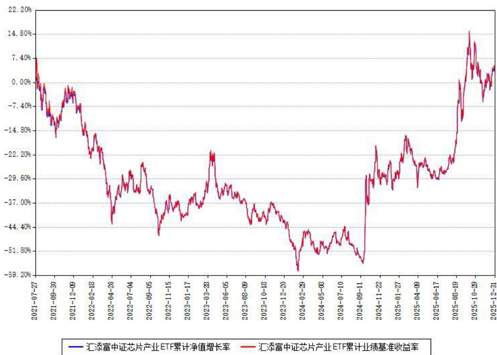
汇添富中证芯片产业ETF累计净值增长率与同期业绩基准收益率对比图

注：本基金建仓期为本《基金合同》生效之日（2021年07月27日）起6个月，建仓期结束时各项资产配置比例符合合同约定。