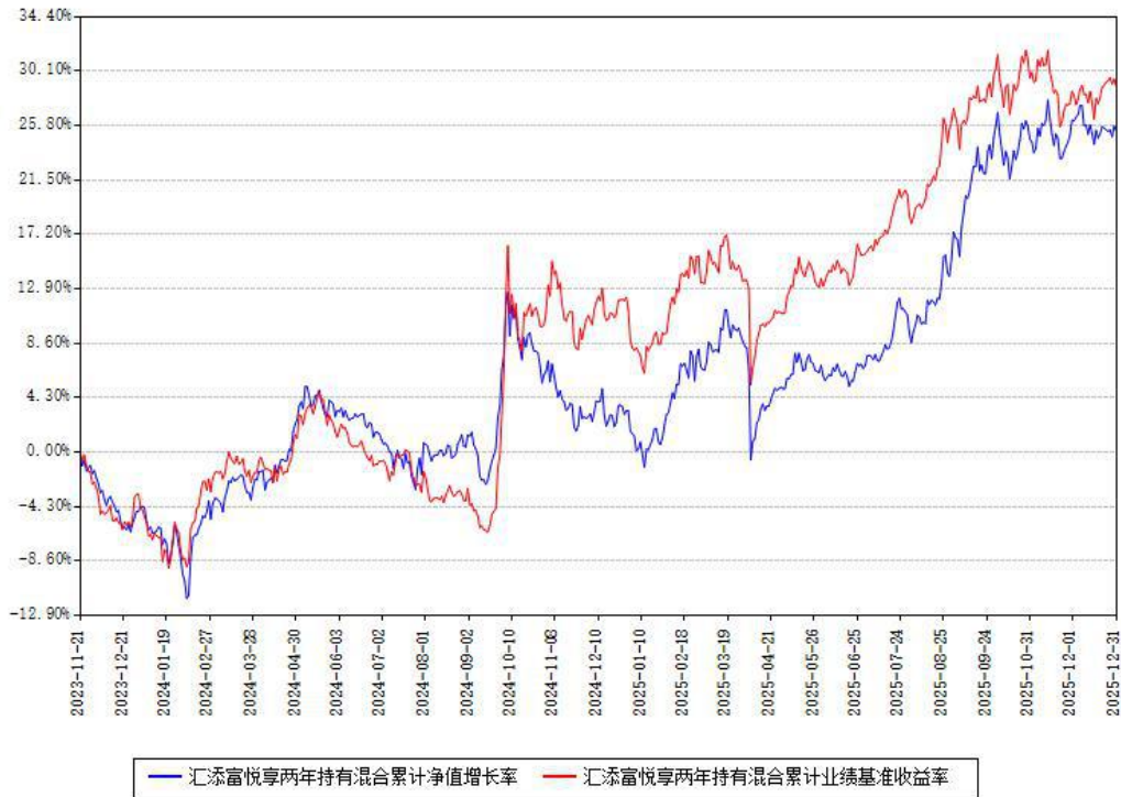
汇添富悦享两年持有混合累计净值增长率与同期业绩基准收益率对比图

注：本基金建仓期为本《基金合同》生效之日（2023年11月21日）起6个月，建仓期结束时各项资产配置比例符合合同约定。