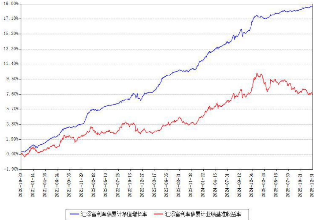
汇添富利率债累计净值增长率与同期业绩基准收益率对比图

注：本基金建仓期为本《基金合同》生效之日（2020年10月30日）起6个月，建仓期结束时各项资产配置比例符合合同约定。