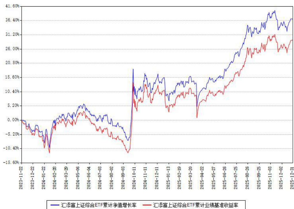
汇添富上证综合ETF累计净值增长率与同期业绩基准收益率对比图

注：本基金建仓期为本《基金合同》生效之日（2023年11月22日）起6个月，建仓期结束时各项资产配置比例符合合同约定。