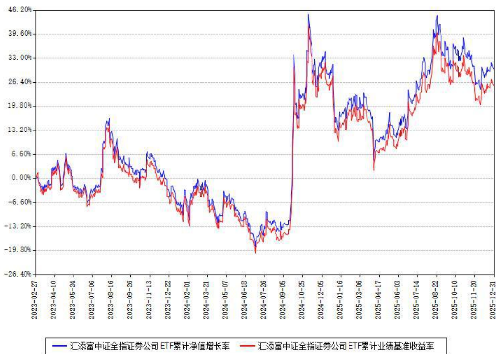
汇添富中证全指证券公司ETF累计净值增长率与同期业绩基准收益率对比图

注：本基金建仓期为本《基金合同》生效之日（2023年02月27日）起6个月，建仓期结束时各项资产配置比例符合合同约定。