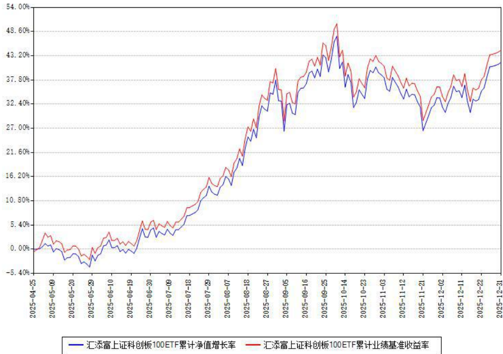
汇添富上证科创板100ETF累计净值增长率与同期业绩基准收益率对比图

注：本《基金合同》生效之日为 2025 年 04 月 25 日，截至本报告期末，基金成立未满一年。本基金建仓期为本《基金合同》生效之日起 6 个月，截至本报告期末，本基金已完成建仓，建仓期结束时各项资产配置比例符合合同约定。