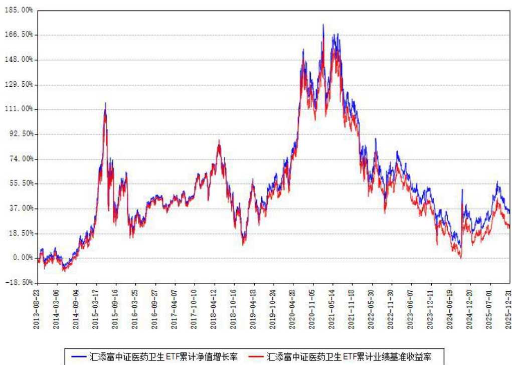
汇添富中证医药卫生ETF累计净值增长率与同期业绩基准收益率对比图

注：本基金建仓期为本《基金合同》生效之日（2013年08月23日）起3个月，建仓期结束时各项资产配置比例符合合同约定。