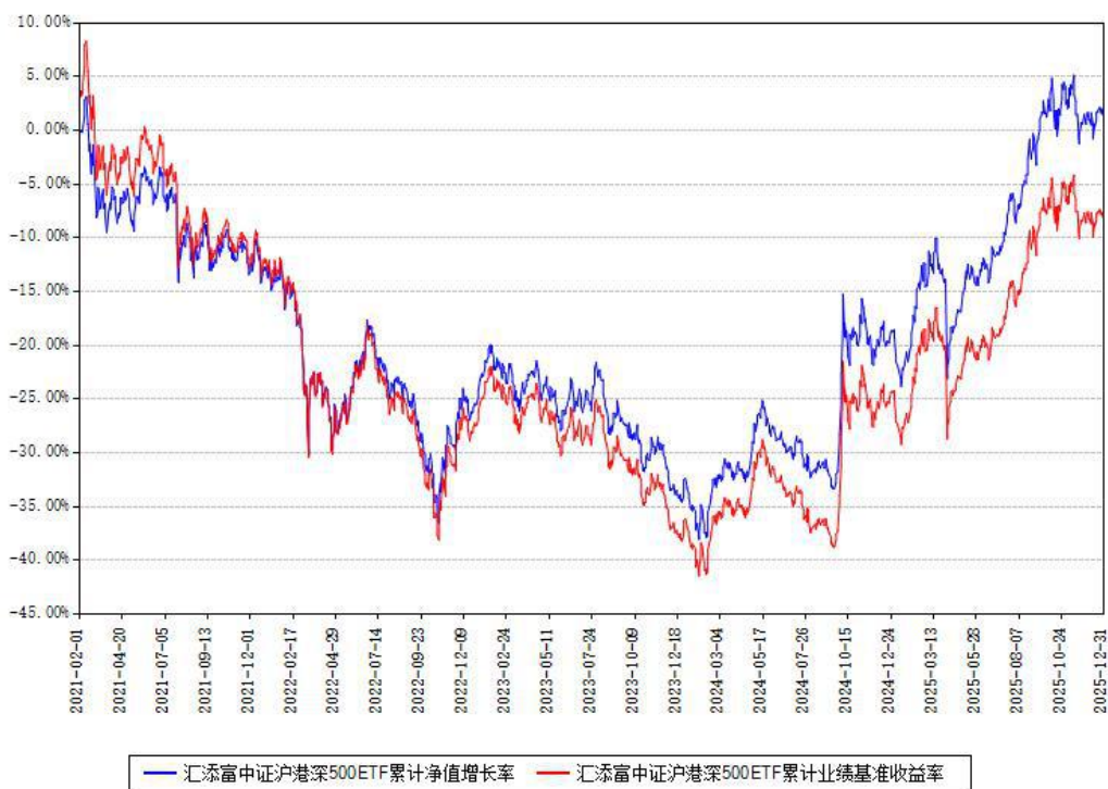
汇添富中证沪港深500ETF累计净值增长率与同期业绩基准收益率对比图

注：本基金建仓期为本《基金合同》生效之日（2021年02月01日）起6个月，建仓期结束时各项资产配置比例符合合同约定。