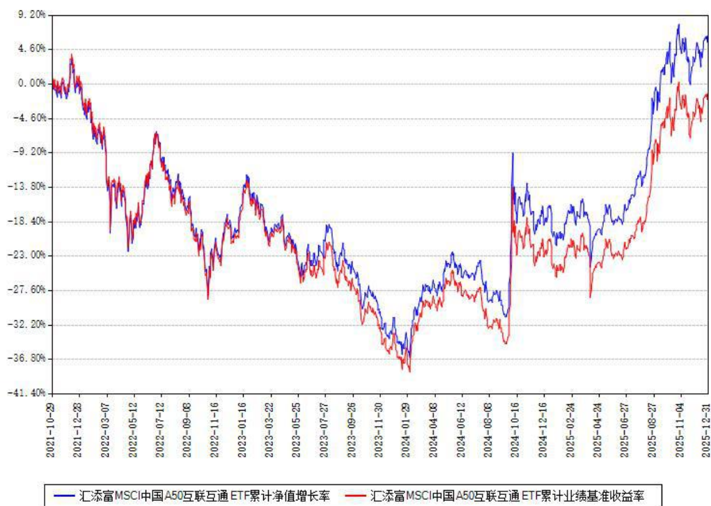
汇添富 MSCI 中国 A50 互联互通 ETF 累计净值增长率与同期业绩比较基准收益率对比图

注：本基金建仓期为本《基金合同》生效之日（2021 年 10 月 29 日）起 6 个月，建仓期结束时各项资产配置比例符合合同约定。