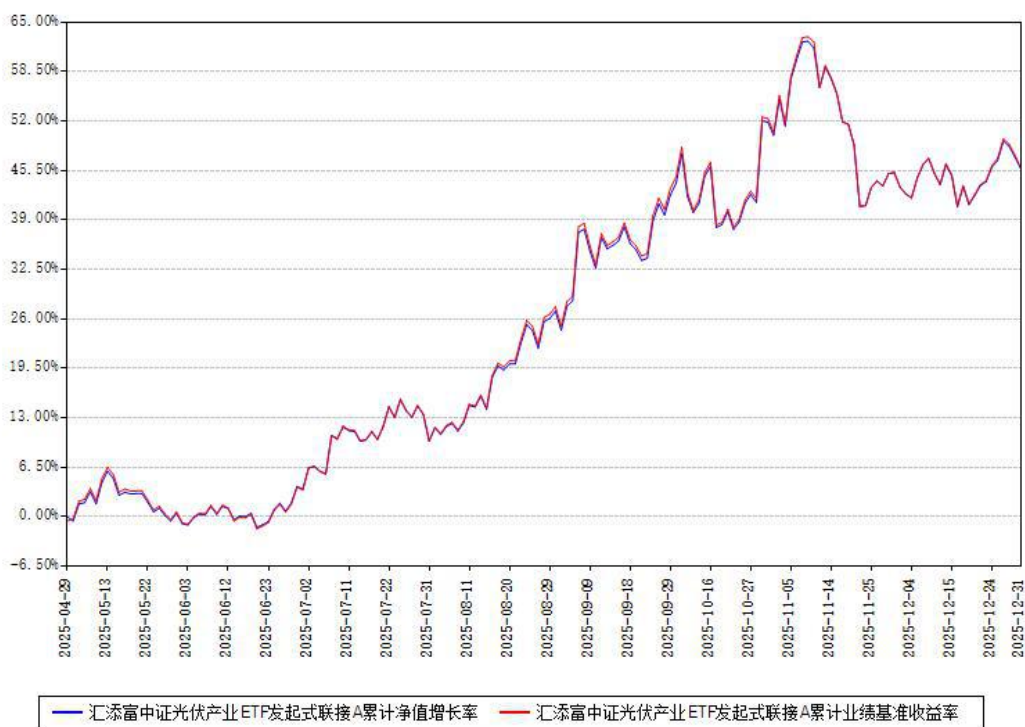
汇添富中证光伏产业ETF发起式联接A累计净值增长率与同期业绩基准收益率对比图