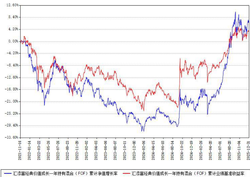
汇添富经典价值成长一年持有混合（FOF）累计净值增长率与同期业绩比较基准收益率对比图

注：本基金建仓期为本《基金合同》生效之日（2021年11月16日）起6个月，建仓期结束时各项资产配置比例符合合同约定。