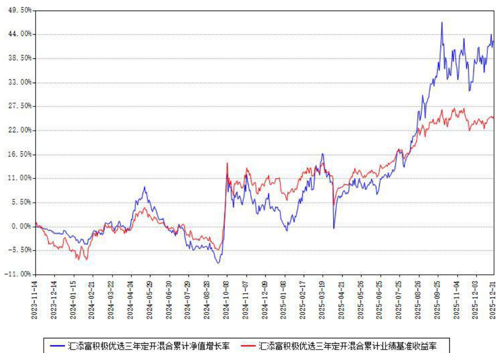
汇添富积极优选三年定开混合累计净值增长率与同期业绩基准收益率对比图

注：本基金建仓期为本《基金合同》生效之日（2023年11月14日）起6个月，建仓期结束时各项资产配置比例符合合同约定。