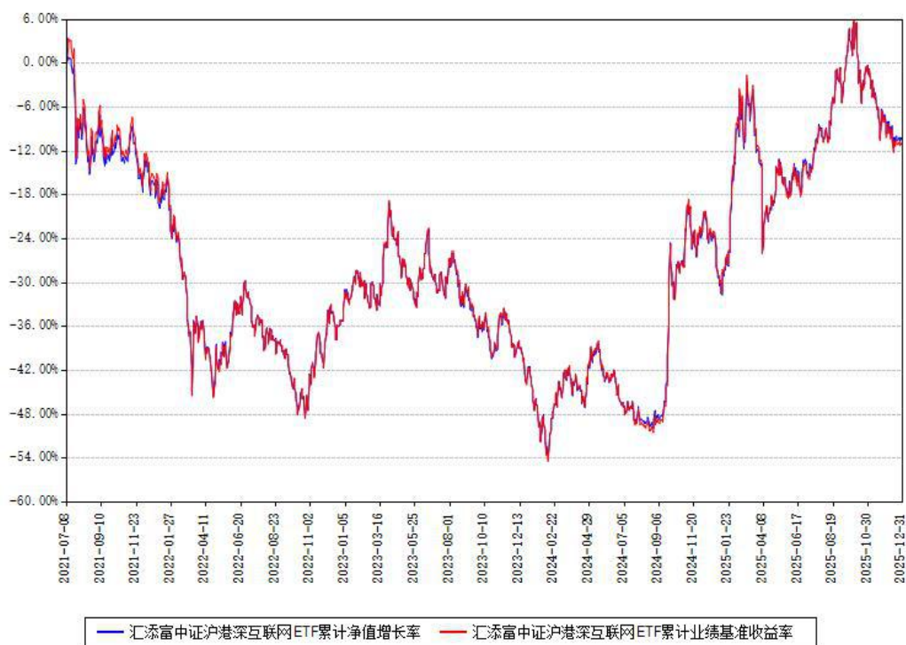
汇添富中证沪港深互联网ETF累计净值增长率与同期业绩比较基准收益率对比图

注：本基金建仓期为本《基金合同》生效之日（2021年07月08日）起6个月，建仓期结束时各项资产配置比例符合合同约定。