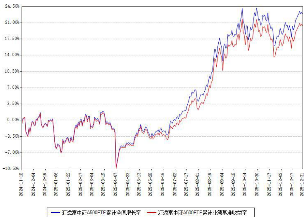
汇添富中证 A500ETF 累计净值增长率与同期业绩基准收益率对比图

注：本基金建仓期为本《基金合同》生效之日（2024 年 11 月 18 日）起 6 个月，建仓期结束时各项资产配置比例符合合同约定。