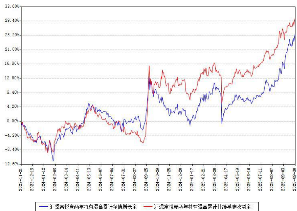
汇添富悦享两年持有混合累计净值增长率与同期业绩基准收益率对比图