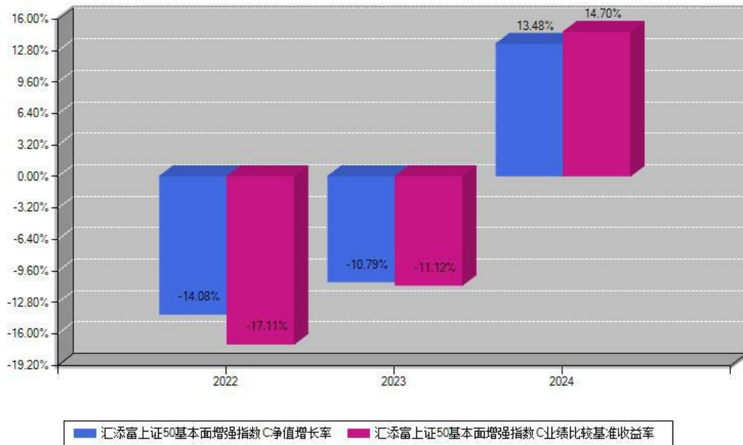
汇添富上证50基本面增强指数C每年净值增长率与同期业绩基准收益率对比图

注：数据截止日期为2024年12月31日，基金的过往业绩不代表未来表现。本《基金合同》生效之日为2022年01月12日，合同生效当年按实际存续期计算，不按整个自然年度进行折算。