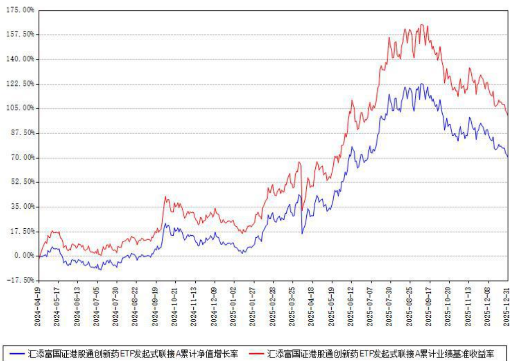
汇添富中证港股通创新药ETF发起式联接A累计净值增长率与同期业绩基准收益率对比图