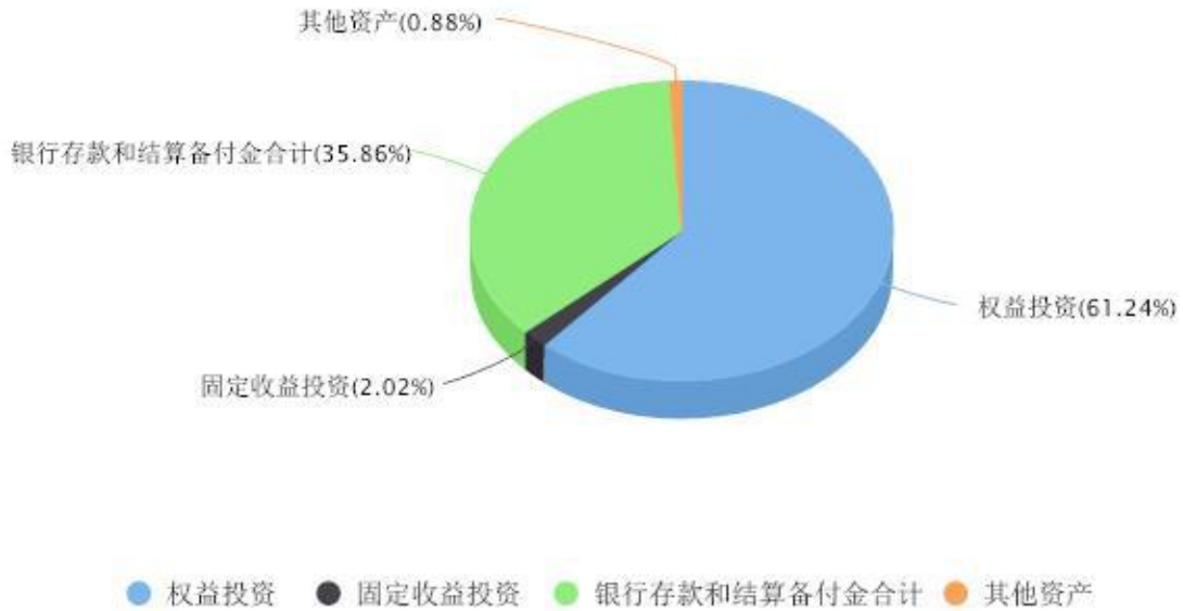
投资组合资产配置图表 数据截止日期:2025年12月31日