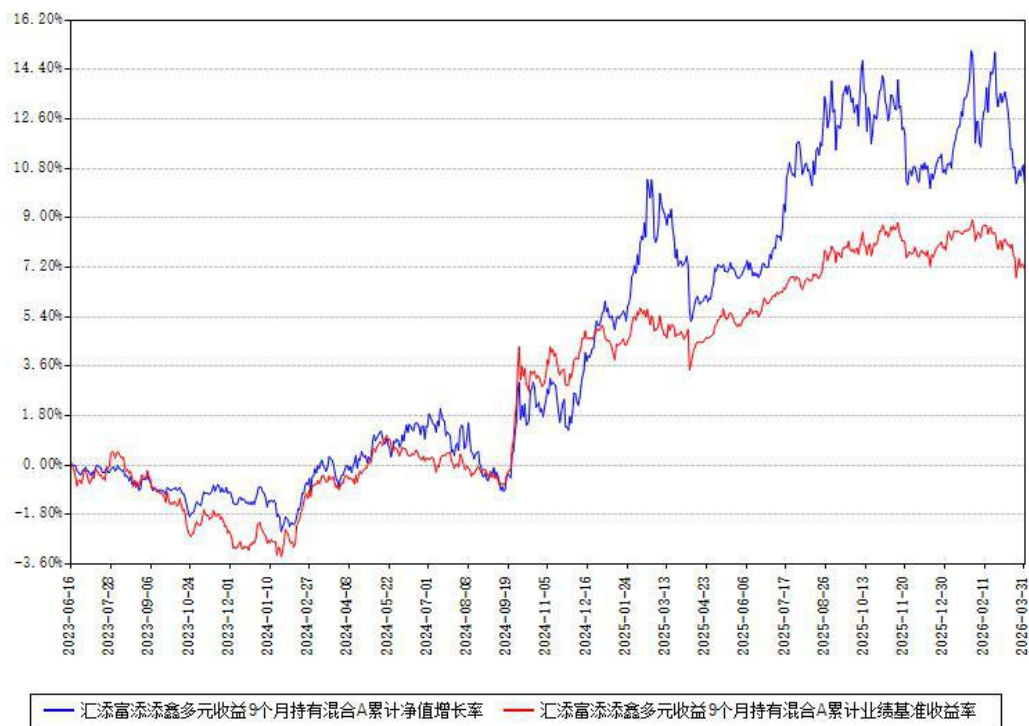
汇添富添鑫多元收益9个月持有混合A累计净值增长率与同期业绩基准收益率对比图