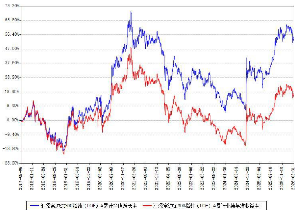
汇添富沪深300指数 (LOF) A 累计净值增长率与同期业绩基准收益率对比图