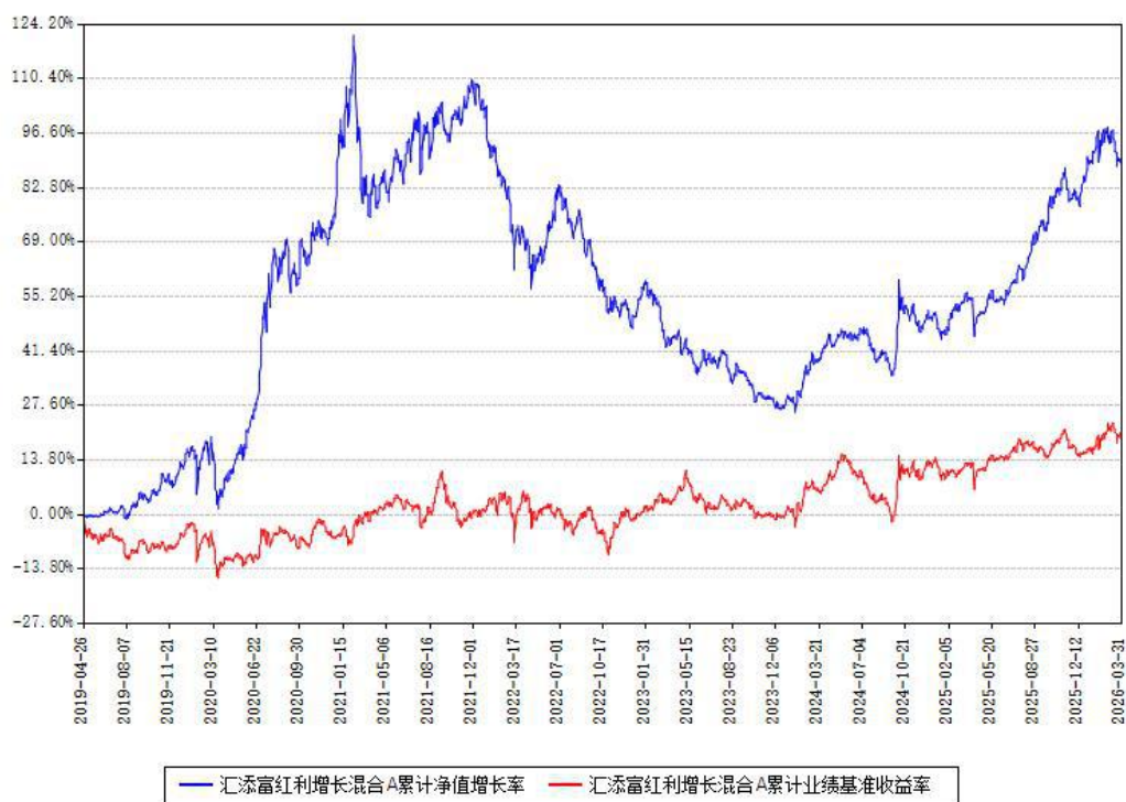
汇添富红利增长混合A累计净值增长率与同期业绩基准收益率对比图