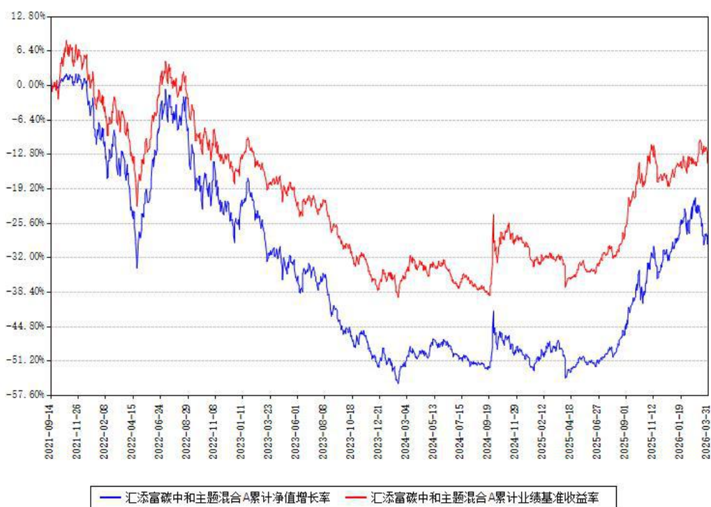
汇添富碳中和主题混合A累计净值增长率与同期业绩基准收益率对比图