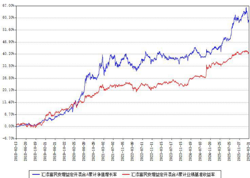
汇添富民安增益定开混合A累计净值增长率与同期业绩基准收益率对比图