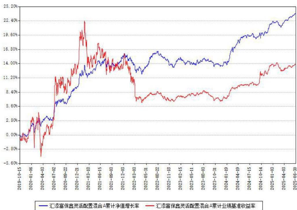
汇添富保鑫灵活配置混合A累计净值增长率与同期业绩基准收益率对比图