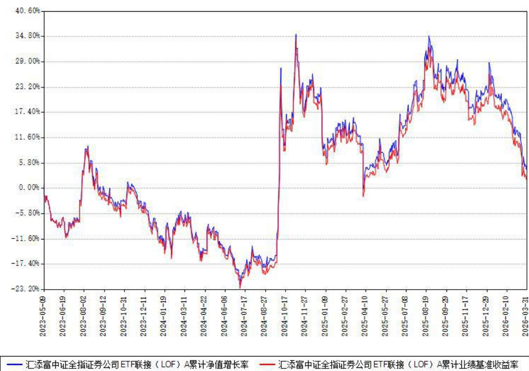
汇添富中证全指证券公司ETF联接（LOF）A累计净值增长率与同期业绩基准收益率对比图