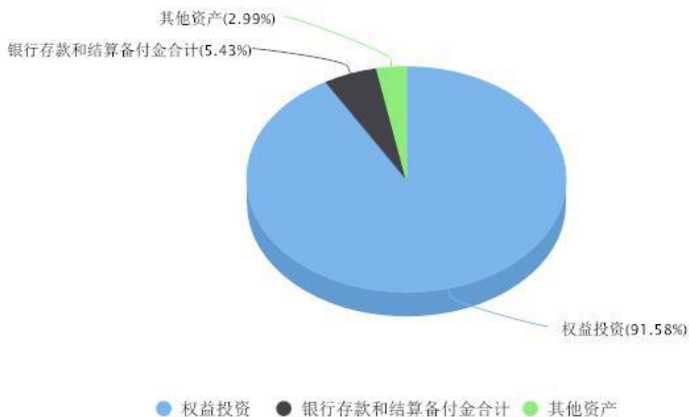
投资组合资产配置图表 数据截止日期:2026年03月31日