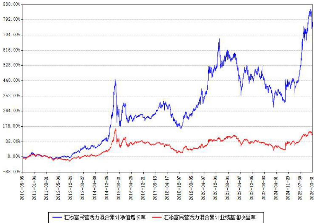
汇添富民营活力混合累计净值增长率与同期业绩基准收益率对比图

(二)自基金合同生效以来基金累计净值增长率变动及其与同期业绩比较基准收益率变动的比较图