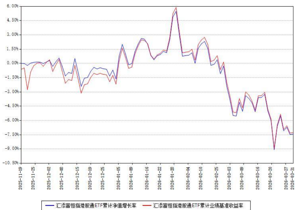
汇添富恒指港股通ETF累计净值增长率与同期业绩基准收益率对比图