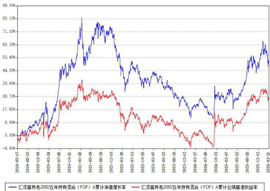
汇添富养老2050五年持有混合 (FOF) A累计净值增长率与同期业绩基准收益率对比图

(二)自基金合同生效以来基金累计净值增长率变动及其与同期业绩比较基准收益率变动的比较图