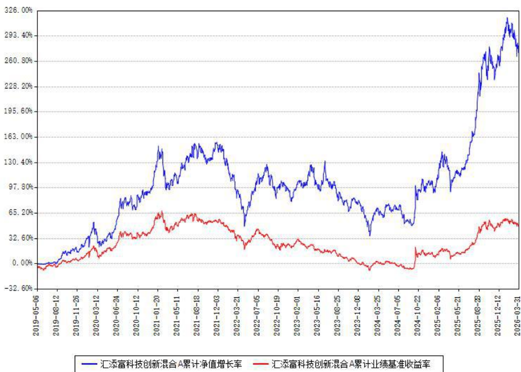
汇添富科技创新混合A累计净值增长率与同期业绩基准收益率对比图

(二)自基金合同生效以来基金累计净值增长率变动及其与同期业绩比较基准收益率变动的比较图