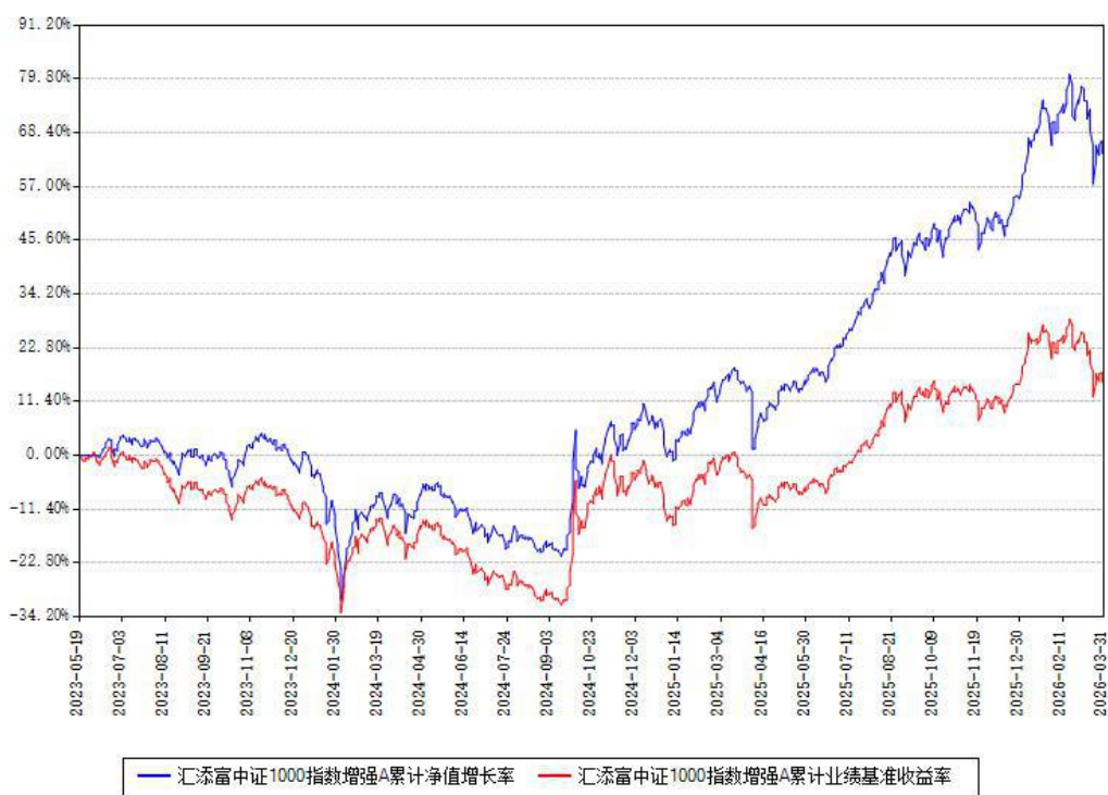
汇添富中证1000指数增强A累计净值增长率与同期业绩基准收益率对比图