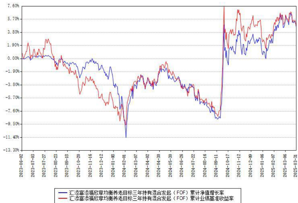
汇添富添福欣享均衡养老目标三年持有混合发起 (FOF) 累计净值增长率与同期业绩基准收益率对比图