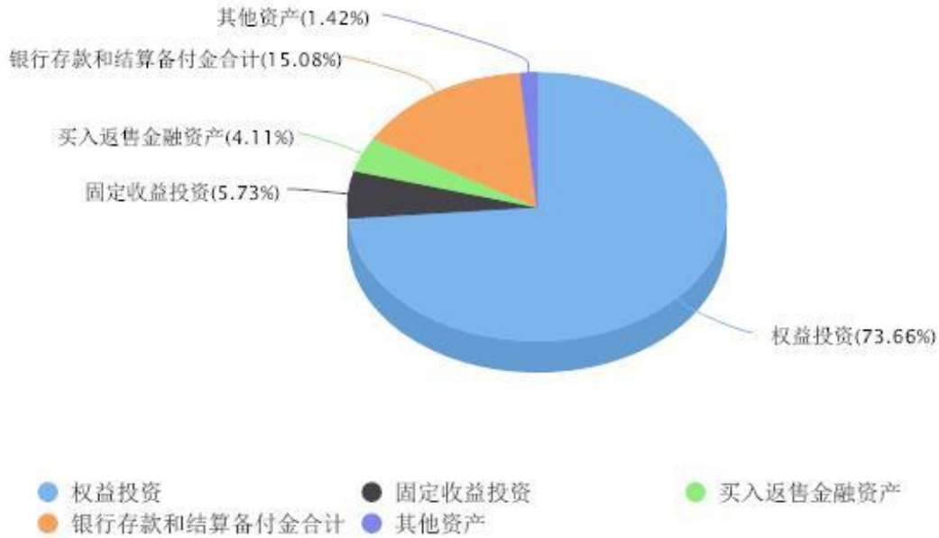
投资组合资产配置图表 数据截止日期:2026年03月31日