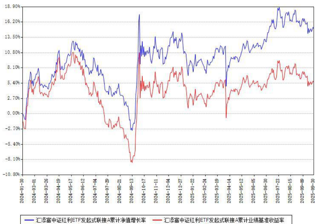
汇添富中证红利ETF发起式联接A累计净值增长率与同期业绩基准收益率对比图