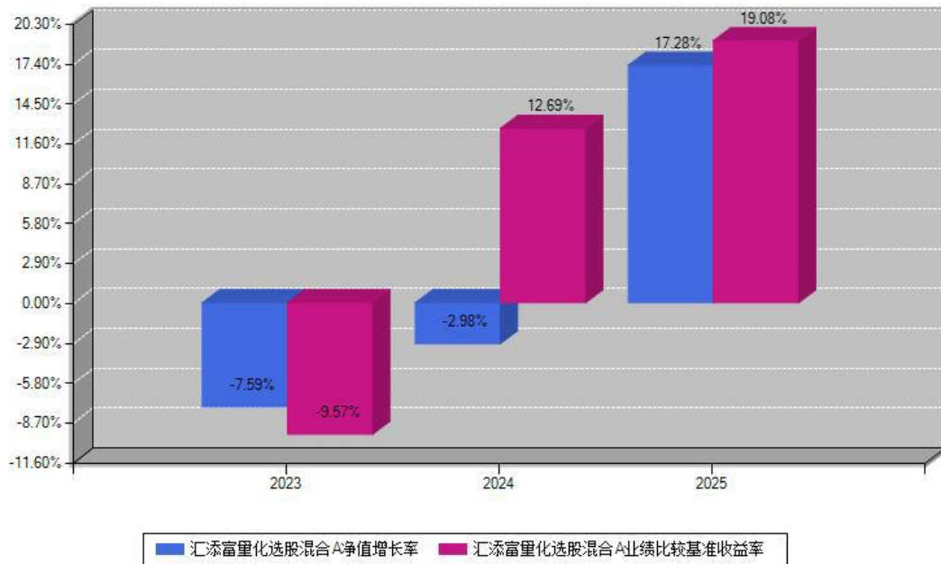
汇添富量化选股混合A每年净值增长率与同期业绩基准收益率对比图

注：数据截止日期为2025年12月31日，基金的过往业绩不代表未来表现。本《基金合同》生效之日为2023年06月06日，合同生效当年按实际存续期计算，不按整个自然年度进行折算。