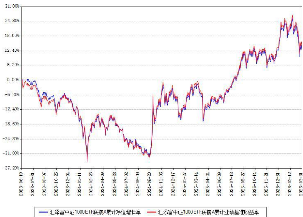
汇添富中证1000ETF联接A累计净值增长率与同期业绩基准收益率对比图